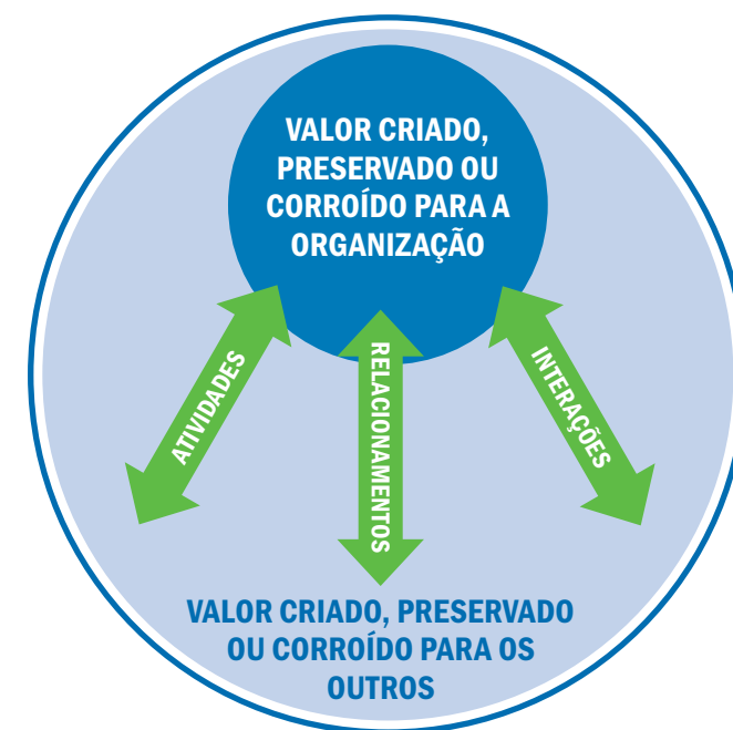
Figura 1 Valor criado, preservado ou corroído para a organização e para os outros

Isto inclui ter em conta até que ponto os efeitos sobre os capitais foram externados (ou seja, os custos ou outros efeitos sobre capitais que não pertencem à organização).