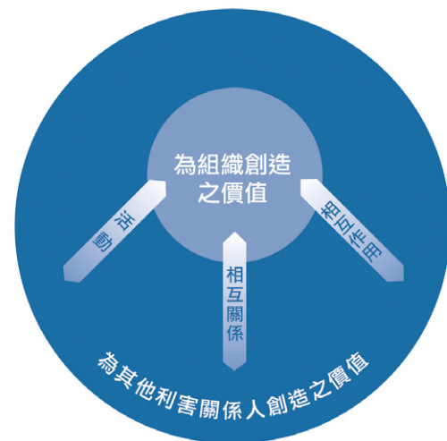
圖 1：為組織和其他利害關係人創造之價值：

2.7 當這些相互作用、活動以及相互關係對於組織為自身創造價值的能力具有重大性時，應納入整合性報告中，包括考量對資本的影響被外部化的程度(亦即非屬組織所擁有的資本之成本或對該資本之其他影響)。